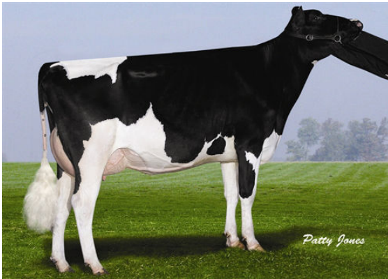
WHITTIER-FARMS HE REBECA FIFTH DAM